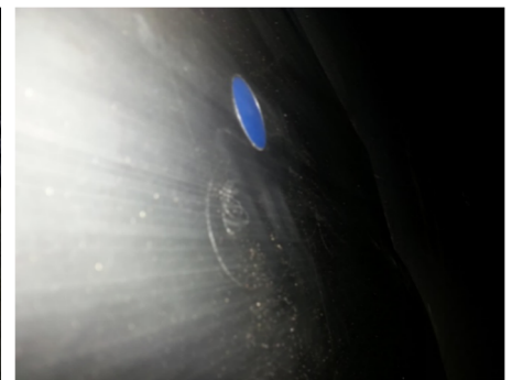
Eingebauter Sensor - Innenansicht

Informieren Sie sich auf unserer Webseite www.avibia.de oder rufen Sie uns an 02263 / 969 07 33 . Wir beraten Sie gern bei der Auswahl und führen unsere Produkte in Ihrem Haus vor. AVIBIA liefert Sensoren und komplette Systemlösungen.