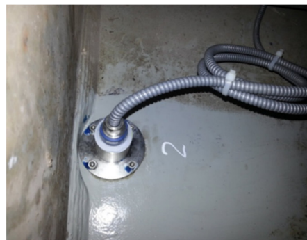
Eingebauter Sensor - Rückansicht